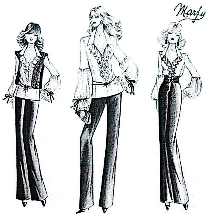
1 сурет. Үлгі эскизі

Пішім; Иініш түрлері; Бедер сызықтырының бар болуы; Бұйым ұзындығы; Жаға түрі; Түймелік түрі; Қалтаның орналасуы; Сәндік бөлшектер және сәндік тігістер.